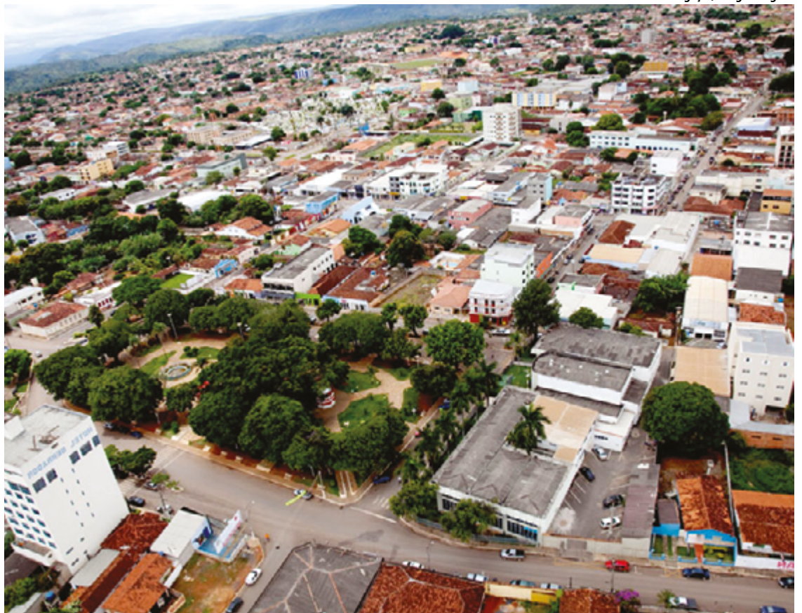
A pré-matricula é realizada no site Formosa.go.gov.br/pre-matricula