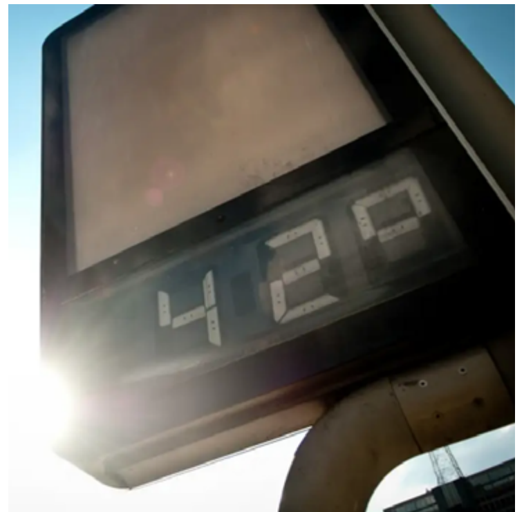
Temperatura média no ano passado foi 1,48 °C mais quente do que na era pré-industrial, de acordo com a agência Copernicus

porada ou apenas um mês que foi excepcional. Foi excepcional por mais da metade do ano. Existem vários fatores que contribuíram para que 2023 fosse o ano mais quente já re-