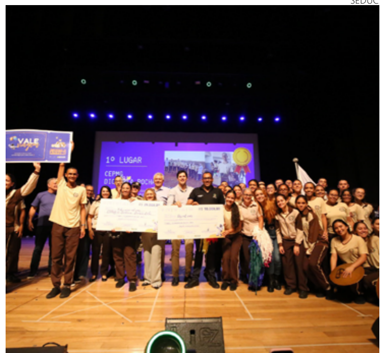
Governador Ronaldo Caiado durante premiação do Programa Estudantes de Atitude

Iniciado em 2021 com objetivo de desenvolver competências do pensamento computacional e habilidades de programação e empreendedorismo entre os alunos das Escolas do Futuro e da rede pública estadual na faixa etária de 9 a 20 anos.