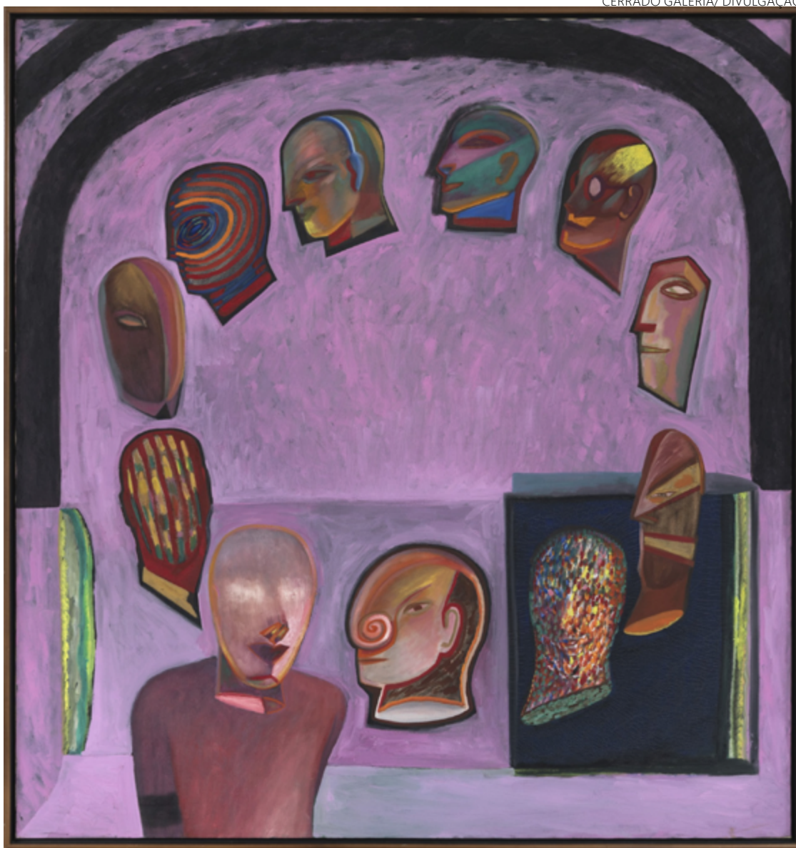
Tela "Constituintes", pintada por Siron Franco, nos anos 1980