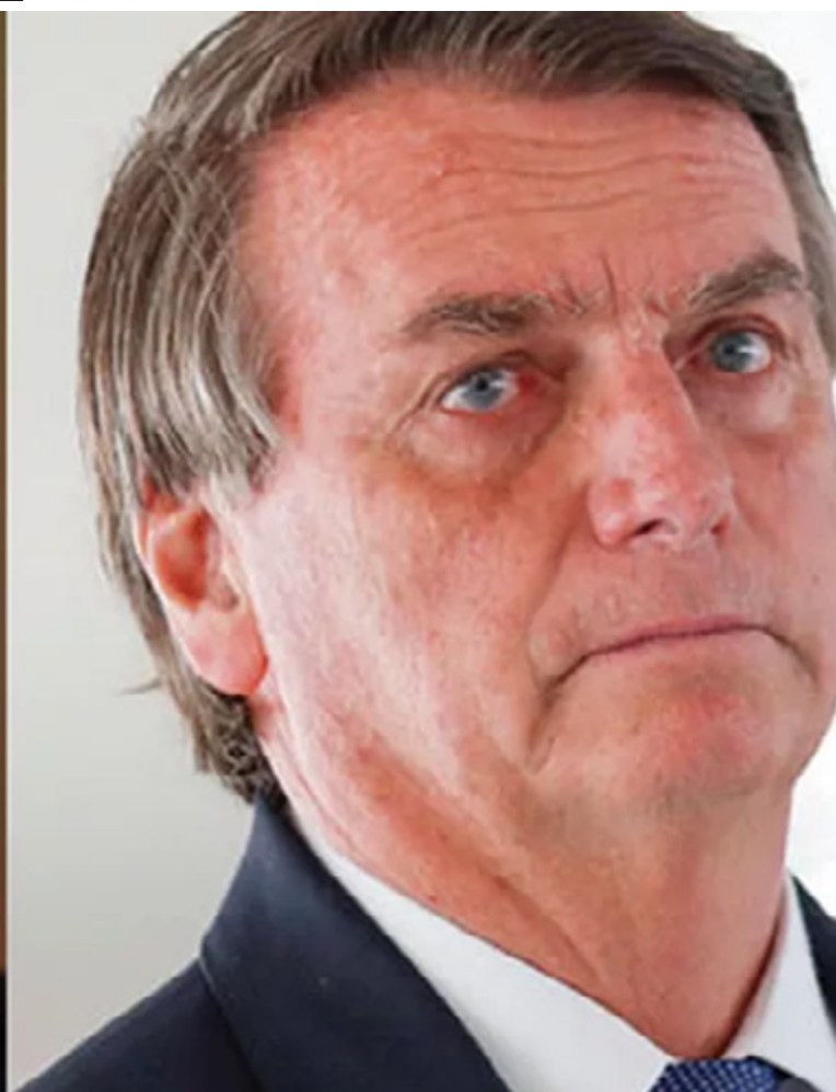
Lula da Silva e Jair Bolsonaro: forte influência nas eleições municipais em todo o país

parlamentares. Eles são seguidos por PSD (5 deputados), União Brasil (5), PDT (3), MDB (3), PSB (3), PSOL (3), PSDB (2), Republicanos (2), Cidadania (1), PV (1) e Rede (1). PP, Avante, Patriota, Solidariedade e Podemos afirmaram ainda não ter uma lista definida. O PC do B não deve ter candidatos.