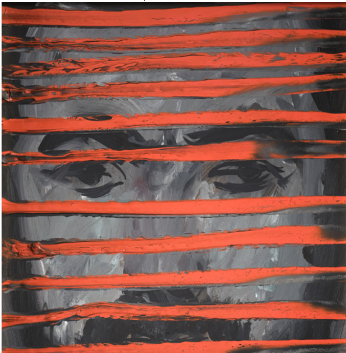
"Retrato do Amigo Tião", obra de Siron Franco, de 1978