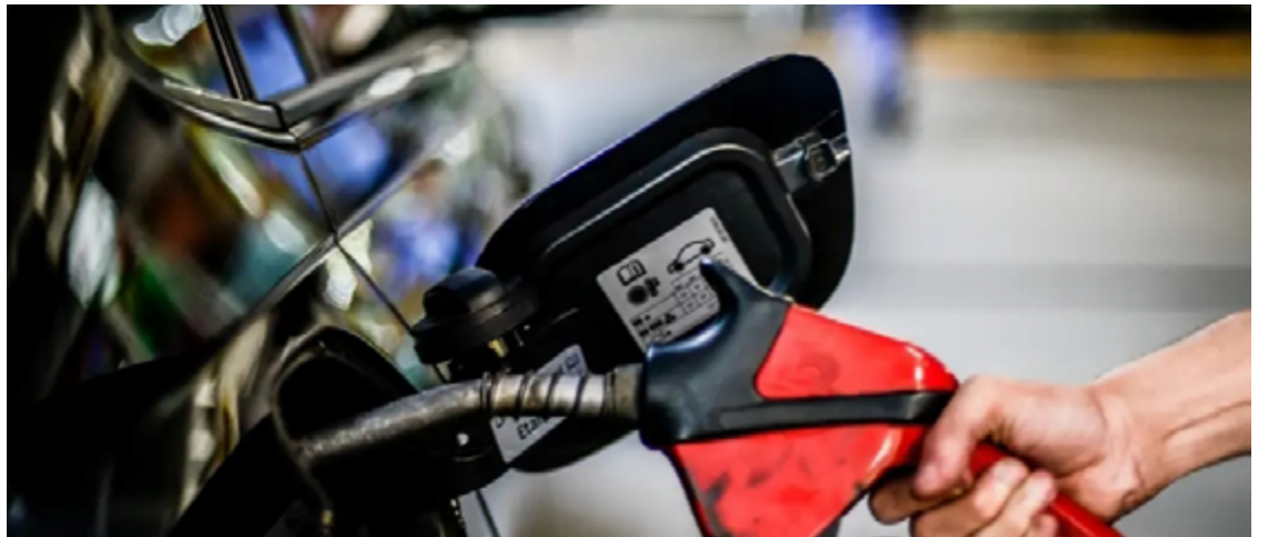
Último reajuste ocorreu há 81 dias quando a Petrobras reduziu o preço do combustível em 4%

O último reajuste da gasolina nas refinarias da Petrobras foi há 81 dias, quando a estatal reduziu o preço do combustível